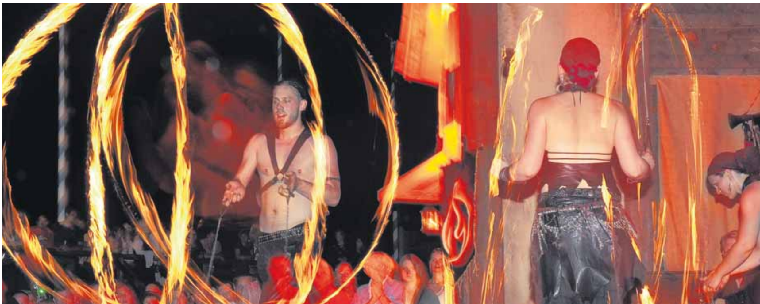
Feuer und Licht waren in den vergangenen Jahren zentrale Elemente der Kaltenberger Gauklernacht und werden es auch heuer wieder sein. Mehr als 200 Künstler aus aller Welt wurden für diesen einen Donnerstagabend verpflichtet, um dem eigenen Anspruch zu genügen und den Besuchern auf dem weiten Gelände um das Schloss ein Festival der Poesie, Gaukelei und Zauberei zu bieten.