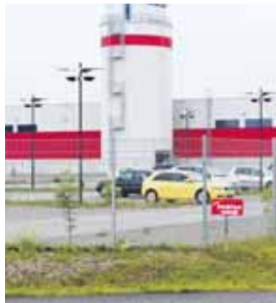
Klausner gehört jetzt der russischen Ilim Timber Gruppe.