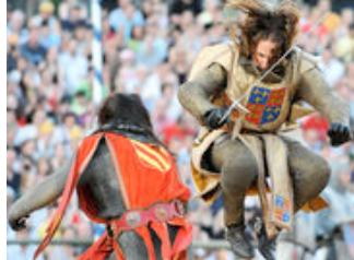
Das Kaltenberger Ritterturnier.

Kaltenberg Die Geschichte von König Artus und seiner Tafelrunde hat die Menschen immer schon fasziniert. Eine Vielzahl von Kinofilmen und Büchern zeugt davon.