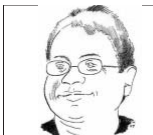
von Richard Ryba