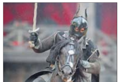
Das Mittelalterspektakel gilt als größtes Ritterturnier der Welt.