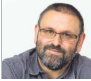
Von Maximilian Bust

Echt. Stark. Oberfranken! Eine Jury bei der Regierung von Oberfranken hat sich am Freitag auf diesen neuen Leitspruch für die Region geeinigt. Er soll künftig bei Besuchern das Interesse an der Region wecken, sie von Oberfranken überzeugen. Das Besondere dabei: Sie, die Leserinnen und Leser der Frankenpost , haben geholfen, dieses Leitmotiv zu finden. Unsere Aktion, zusammen mit drei weiteren oberfränkischen Tageszeitungen, hat gezeigt, wie